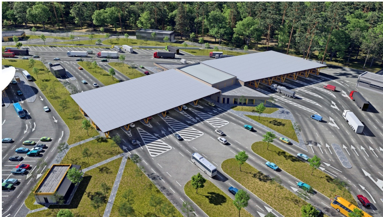
Cruce fronterizo Dorohusk-Yahodyn

A.S.—¿Se nota o es muy visible el contraste entre nuestro mundo Occidental y el de Ucrania?